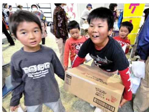
お菓子を抱えて帰る子どもたち

三重から物資を運んだスタッフも、佐用町の皆さんの笑顔を拝見し、手渡される物産に一喜一憂してお声を発せられるその場の楽しげな様子を眺めながら、ひと時三重の物産を囲み、楽しい時間を過ごしていただけたことに対して、お届けできてよかったと嬉しい気持ちになりました。