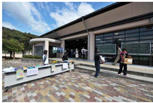
南光生きがいドーム

当日まで現地と調整を重ねながら、被災された方々がひと時楽しんでいただけるよう、防災ボランティアコーディネーターらが工夫し、手作りで作成した「魚つりゲーム」の景品として、企業、個人からご提供いただいた三重県の物産品をお配りできるよう準備を進めました。