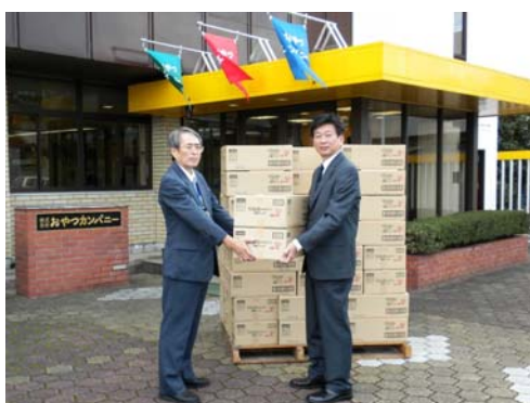
(株)おやつカンパニー様より、ミニカップラーメン寄贈